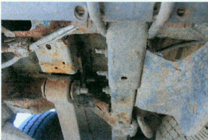
Widok elementów konstrukcyjnych nadwozia