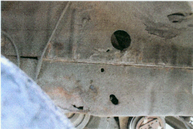
Widok wnętrza koła przedniego prawego