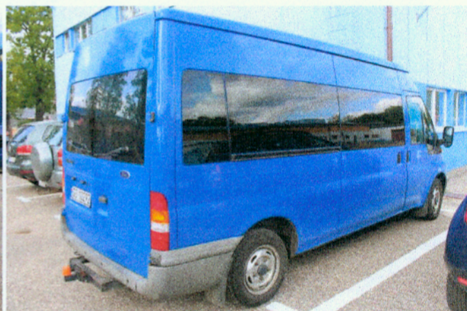
Widok z prawego boku pojazdu