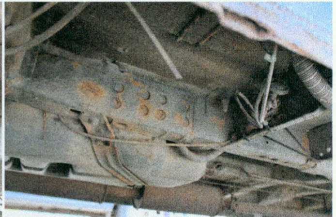
Widok elementów konstrukcyjnych nadwozia