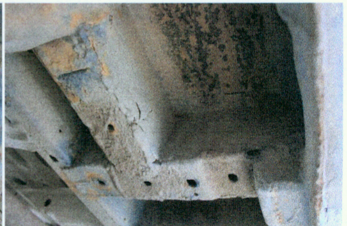
Widok elementów konstrukcyjnych nadwozia