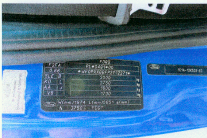
Widok wklejki identyfikacyjnej