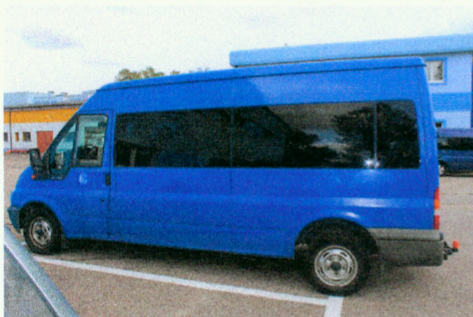
Widok z lewego boku pojazdu