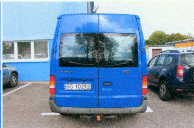
Widok z tyłu pojazdu