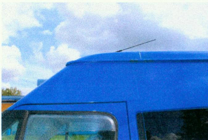
Widok ognisk korozyjnych nadwozia