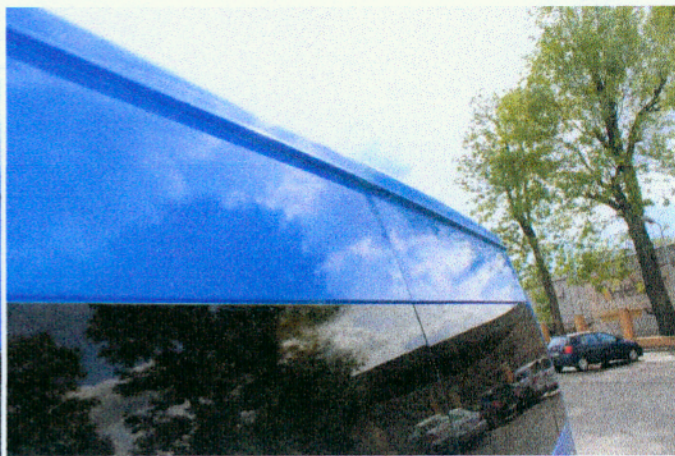
Widok uszkodzenia nadwozia