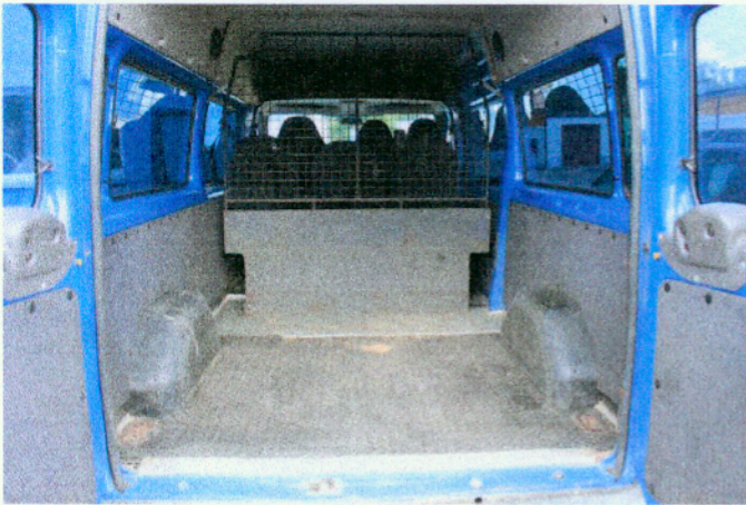
Widok przedziału bagażowego