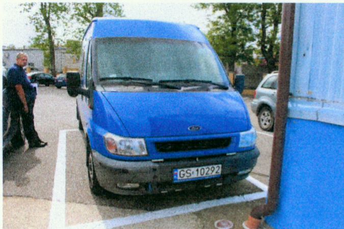
Widok z przodu pojazdu

Rodzaj pojazdu: Samochód ciężarowy do 3.5t